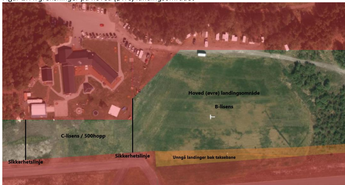
Figur 2: Avgrensninger på hoved (øvre) landingsområdet

Alle landinger bak taksebane skal unngås pga turbulens og flyaktivitet.